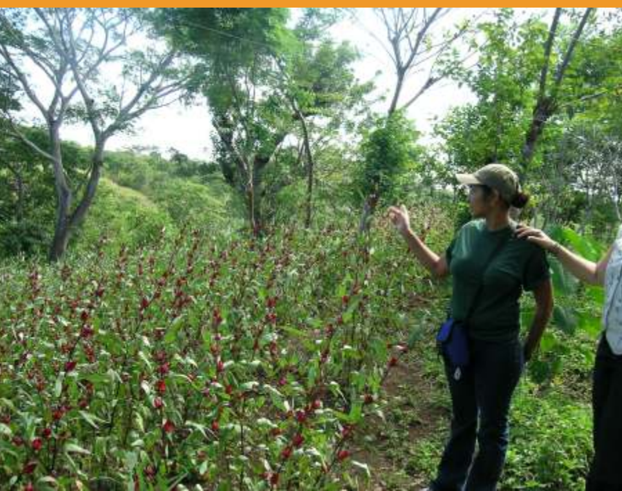
Técnico de la Asociación Nochari

cuencas hidrográficas como unidades territoriales estratégicas para la gestión del territorio.