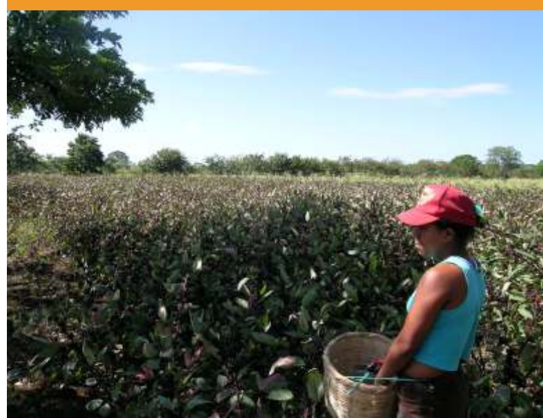
Cosechando Flor de jamaica

Este enfoque considera el territorio como una unidad natural en la cual debe haber un uso sostenible de los recursos naturales para garantizar un equilibrio