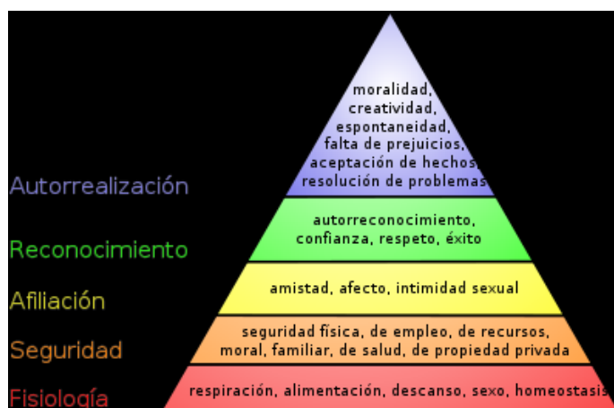
Figura 1 Pirámide de Maslow.

También puede decirse que el desarrollo humano implica satisfacer las necesidades identificadas por Abraham Maslow en la denominada Pirámide de Maslow.